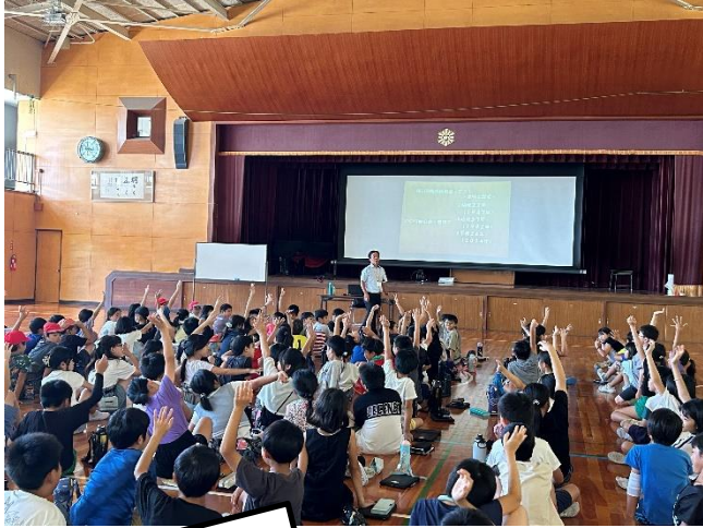
全体講義〈赤い羽根募金〉