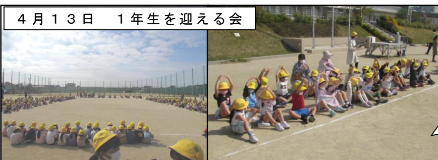
4月13日 1年生を迎える会

快晴の空のもと、先生へのインタビューや児童会のO×ゲームも大変盛り上がりました。1年生へのインタビューでは、しっかりした受け答えができていました。企画してくれた児童会役員のみなさんに感謝です。