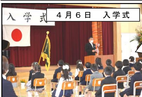
入学式 4月6日 入学式

4月6日(水)の入学式では、新1年生82名が竹の山小学校の新しい仲間になりました。18日の今年最初の朝会では、今年がんばる3つのことについて話をしました。①ともに学びを深める竹っ子になろう！②自分も友達も大切に、ともに高め合う竹っ子になろう！③本気で取り組む竹っ子になろう！です。詳細については、ぜひお子様に聞いてあげてください。コロナ禍は続くことが予想されますが、子どもたちが毎日笑顔で安心して学校生活を過ごせるよう、今年度も本校の教育活動に対しご理解とご協力をよろしくお願いいたします。