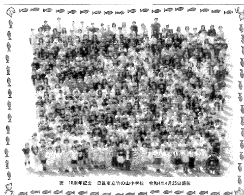
④集合写真（にっこり）