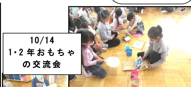
10/14 1・2年おもちゃの交流会

1泊2日を仲間と過ごすことができ、「習学良好～持っていくのはルールとマナー 持って帰るのは最高の思い出～」を体現できた2日間でした。自分たちで率先して行動する姿が印象的でした。