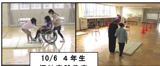
10/6 4年生 福祉実践教室

けじめをつけるときはしっかりつける！メリハリの効いた素晴らしい2日間となりました。美浜少年自然の家の方からも「聞く姿勢がとても良い」とほめていただきました。