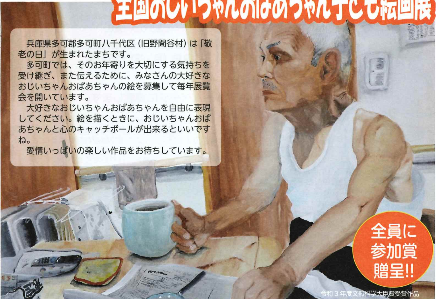
令和3年度文部科学大臣賞受賞作品